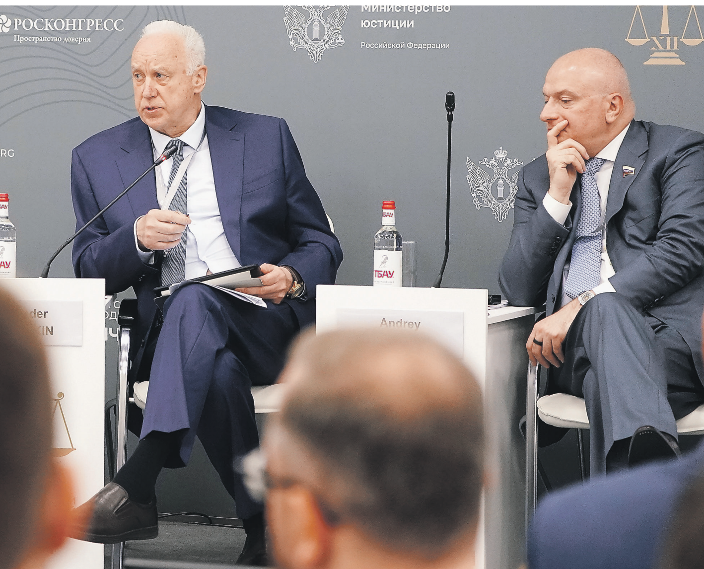
Министерство Юстиции Российской Федерации

Поэтому основную задачу российского миграционного законодательства он видит в том, чтобы создавались правила, которые заставляли бы людей адаптироваться к тем условиям и требованиям, которые действуют в России.