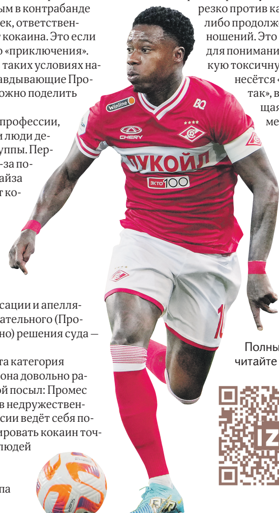
Полный текст читайте на iz.ru

термоядерной аудитории, резко против какого-либо продолжения отношений. Это важно для понимания, в какую токсичную яму несётся «Спартак», возвращая Промеса.