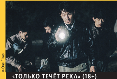
«ТОЛЬКО ТЕЧЁТ РЕКА» (18+)

Провинциальный китайский городок потрясён убийством безобидной ста-