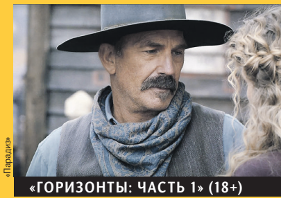
«ГОРИЗОНТЫ: ЧАСТЬ 1» (18+)

Фронтир середины XIX века. Переселенцы спасаются от набегов воинов