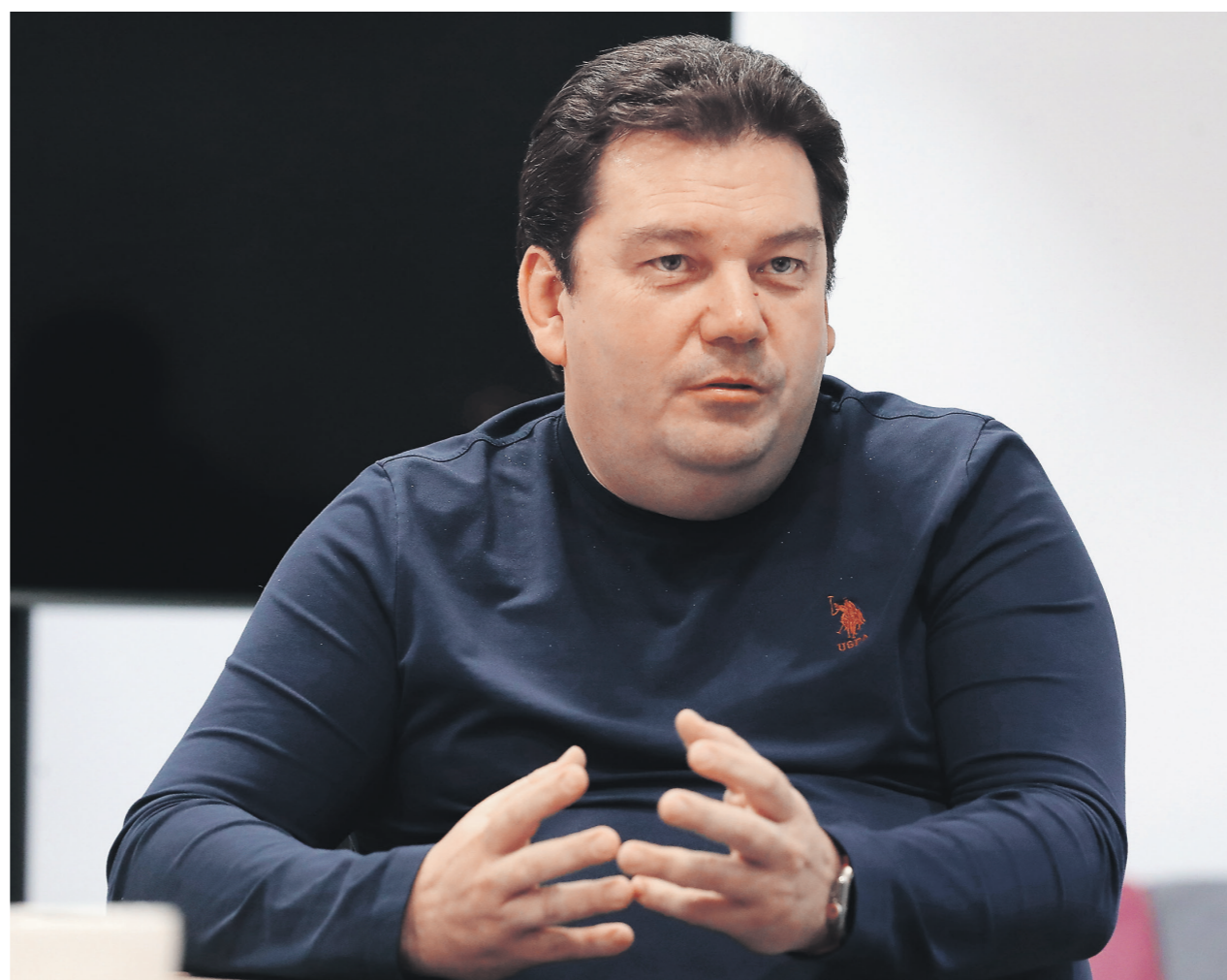
Андрей Зинуров / Иллюстрация

Тут дело скорее не в дефиците оборудования, а в экономике вопроса и инфраструктуре, которая нужна для подключения площадок. Базовая станция, установленная на мачте, не будет работать без электричества. И в основном мы опираемся именно на эту проблему. В стране довольно много малонаселённых мест, где получить электроснабже-