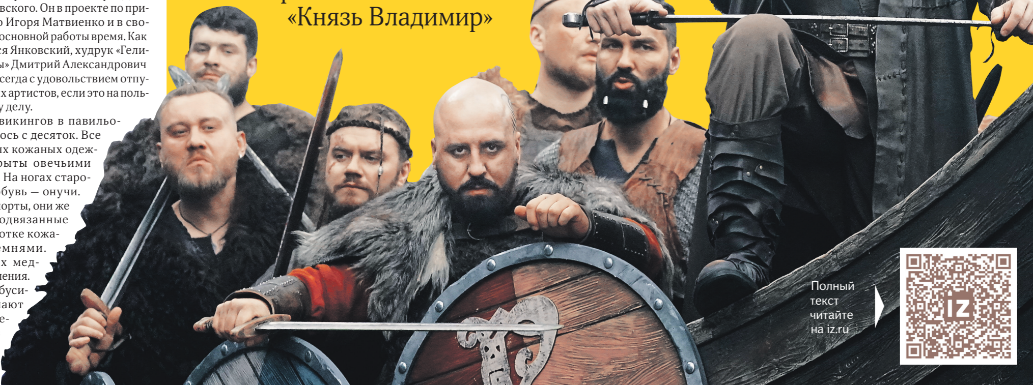
Полный текст читайте на iz.ru

Певец снялся в клипе к этно-опере Игоря Матвиенко «Князь Владимир»