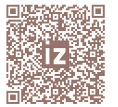
Полный текст читайте на iz.ru

Нет, давайте без крайностей. Любое соревнование не территории Российской Федерации внесено в календарный план. Например, соревнования 12-летних мальчишек в регионе является официальным соревнованием. Оно должно отвечать определённым требованиям по безопасности — например, медицинскому и пожарному обеспечению. На такие соревнования активно не ходят болельщики, если сравнивать даже с играми ЮФЛ. Но требования к Медиалиге, где на некоторые матчи ходит достаточно много болельщиков, ниже. Выстраивается странная картина. При проведении соревнований на уровне детско-юношеских школ вы должны потратить огромное количество денег, выбить их из бюджета для реализации требований правил проведения. А если вы частный организатор — творите что хотите.