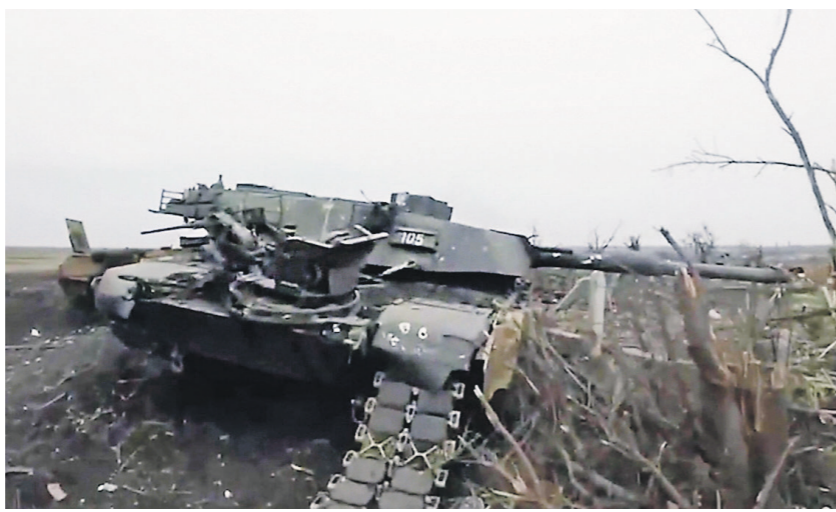
Подбитый танк Abrams под Авдеевкой

— Я не думаю, что, скажем, Соединённые Штаты, к примеру, или другие западные страны стремятся к прямому участию их вооружённых сил в конфликте на Украине. Они всё стремятся использовать Украину как прокси, с которым они заключили договор, снабжают его деньгами и вооружением. Опыт Вьетнама, опыт Афганиста-