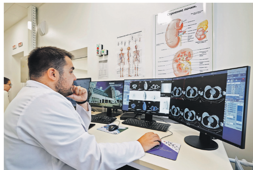
Зауров Корнилов / Иллюстрация

— Основные векторы её применения — это оценка работы органов и систем при каком-либо заболевании, — рассказал врач. — Оцениваются заданные параметры, в том числе степень тяжести, наличие коморбидной патологии, и проводится анализ того, как виртуально данная система или орган будет работать при каком-то из опасных заболеваний.