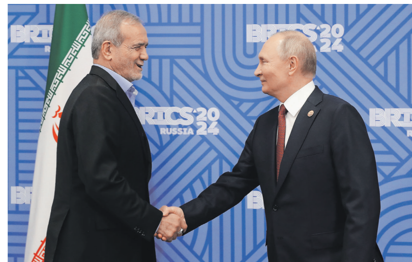
Владимир Путин встречает президента Ирана Масуда Пезешкиана