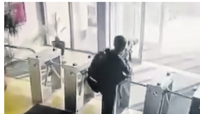
В результате нападения на предприятие погибли несколько человек, более 20 получили ранения

Реджеп Тайип Эрдоган решил превратить свою программу в Казани и в четверг утром возвращается в Турцию, утверждает телеканал CNN Türk.