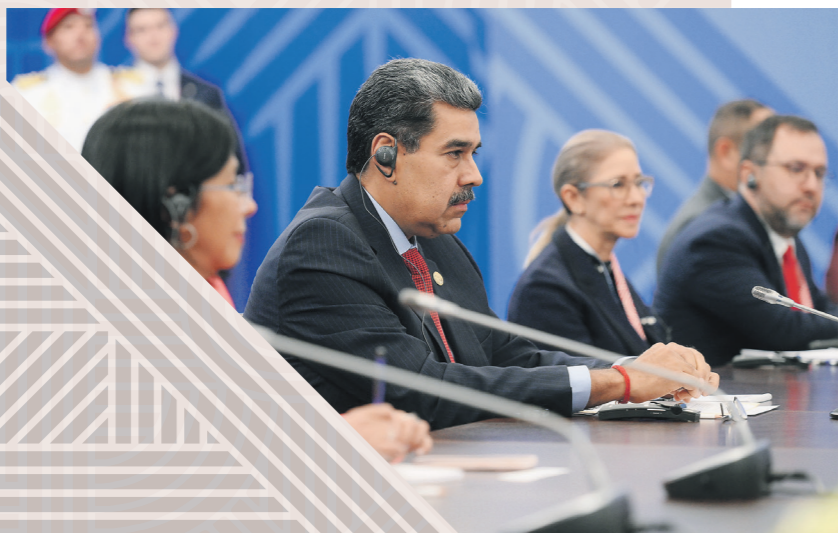
Николас Мадуро, президент Венесуэлы

— Чтобы в максимальной степени реализовать потенциал наших растущих экономик, воспользоваться всеми преимуществами новой волны глобального экономического роста, нашим странам необходимо активизировать сотрудничество в таких областях, как