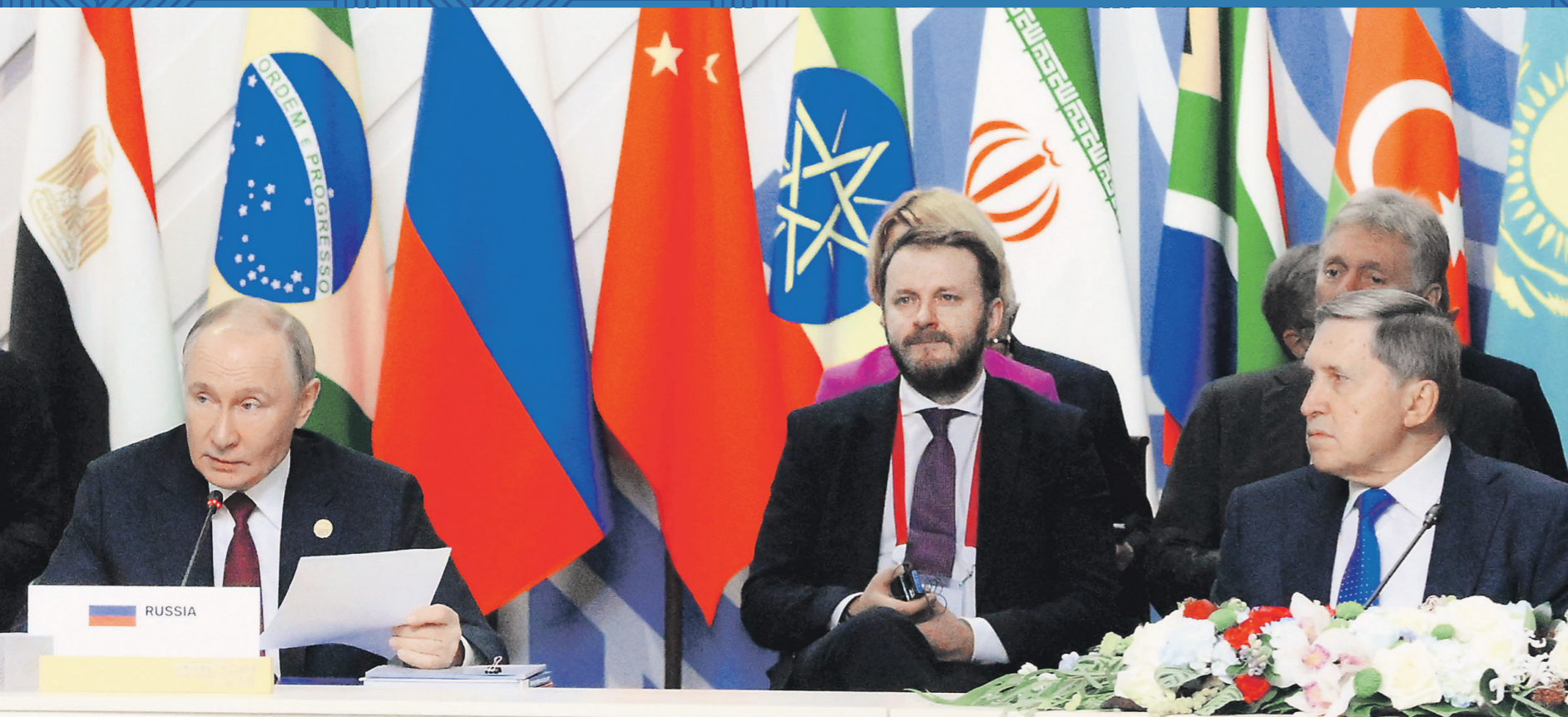
Сергей Бобылев | Фото: агентство brics-russia2024.ru