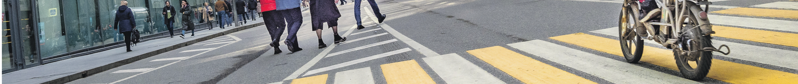
Коллектив Команда / Иллюстрация