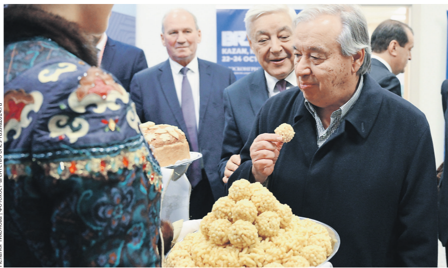
Елена Тюмина