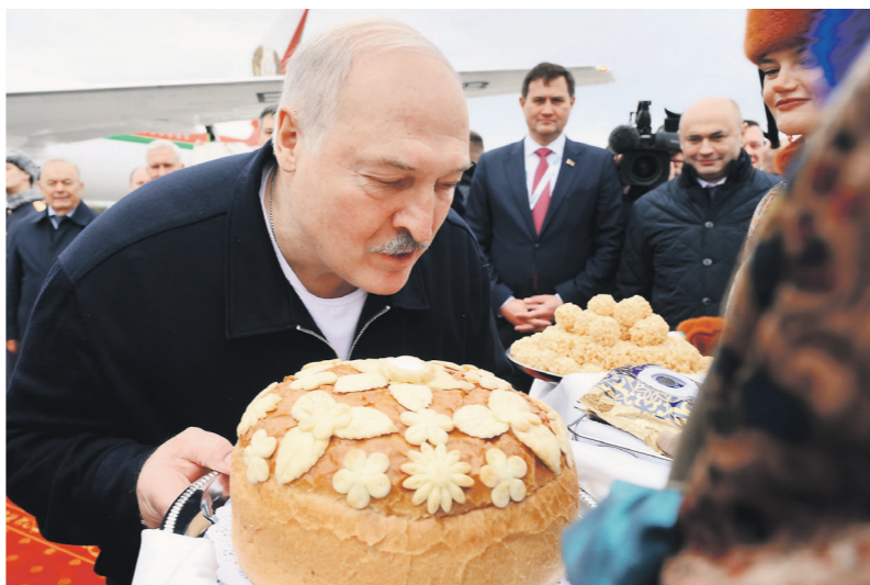
Президент Белоруссии Александр Лукашенко