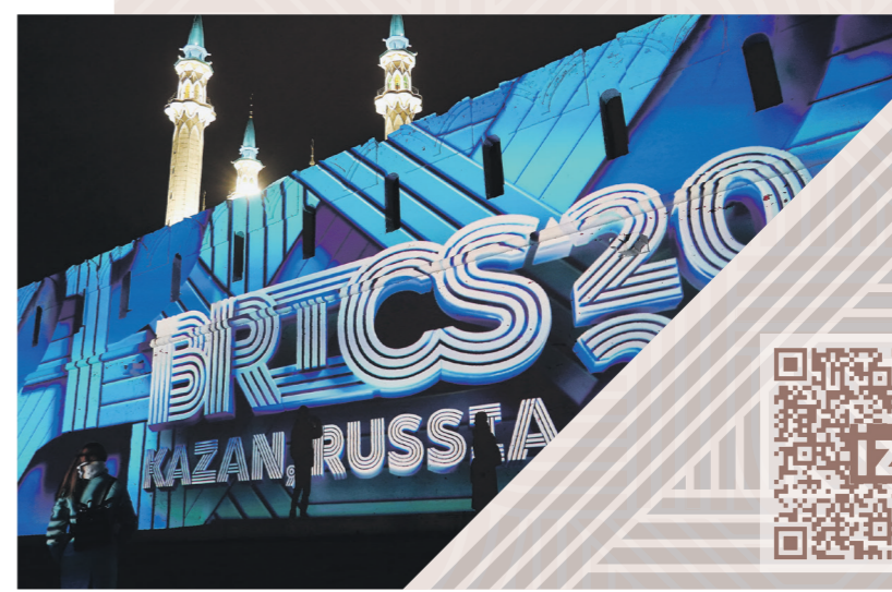
Павел Волков | «Известия»