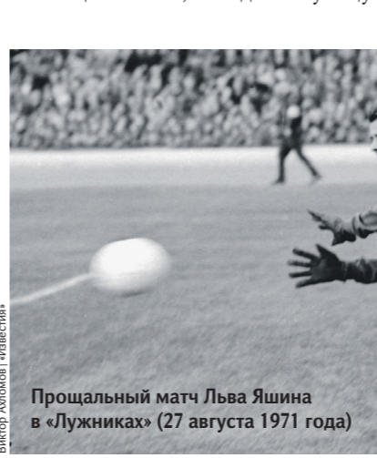
Прощальный матч Льва Яшина в «Лужниках» (27 августа 1971 года)