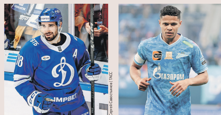
Сергей Савицкий | ИСС

Президент России Владимир Путин предоставил российское гражданство канадскому хоккеисту московского «Динамо» Седрику Пакетту и бразильскому футболисту «Зенита» из Санкт-Петербурга Дугласу дос Сантосу Жустино де Мело.