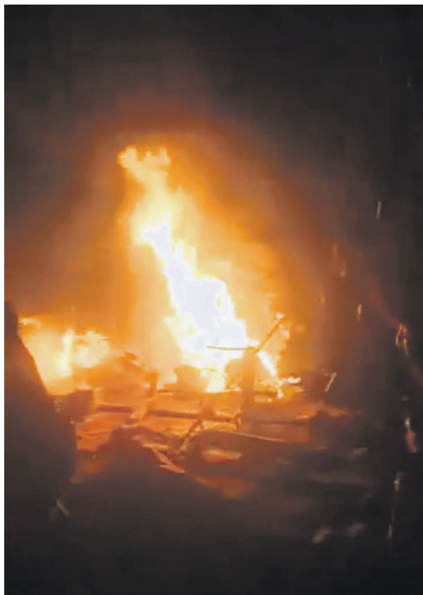
Самолёт был сбит «Силами быстрого реагирования» — военизированной структурой, противодействующей законным властям Судана

Российские дипломаты добавили: посольство находится в контакте с суданскими властями и предпринимает все необходимые действия для выяснения обстоятельств инцидента. При этом продолжает проверять вся информация об инциденте. Дипломаты подчеркнули: ситуация осложняется тем, что зона крушения находится в Дарфуре — регионе Судана, где продолжаются бои между СБР и регулярной армией страны.