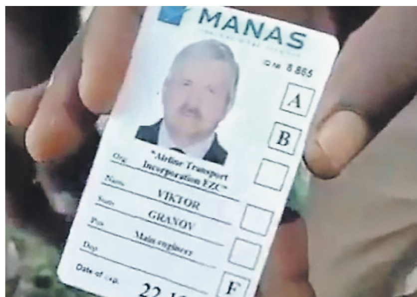
В соцсетях появились фото с документами россиян, которые могли быть членами экипажа сбитого самолёта