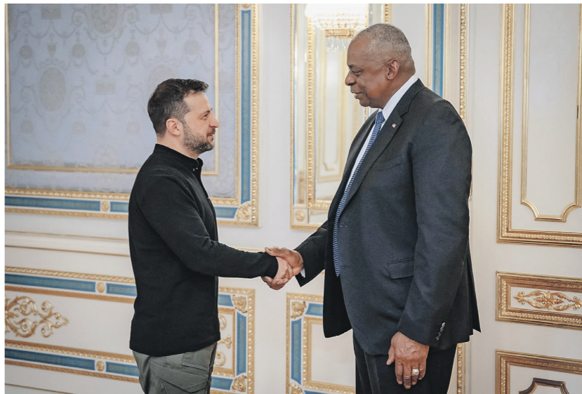
Министр обороны США Ллойд Остин обещал новый пакет военной помощи Украине

При этом, как подчёркивает The Wall Street Journal, Остин не дал украинцам разрешения использовать ракеты дальнего радиуса действия для ударов вглубь территории России. Этого уже многие месяцы требует Зеленский. По его словам, это чуть ли не основное условие победы Киева.