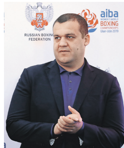
Умар Кремлёв

Президент Международной боксёрской ассоциации (ИВА) Умар Кремлёв был одним из наиболее активных участников прошедшего на прошлой неделе в Уфе форума «Россия — спортивная держава» и состоявшегося в его рамках заседания Совета при президенте РФ по развитию физической культуры и спорта. Влиятельный функционер прокомментировал одно из ключевых решений, принятых на совете, — позволить министру спорта РФ Михаилу Дегтярёву выдвинуть свою кандидатуру на пост президента Олимпийского комитета России (ОКР), который в декабре покинет Станислав Поздняков.