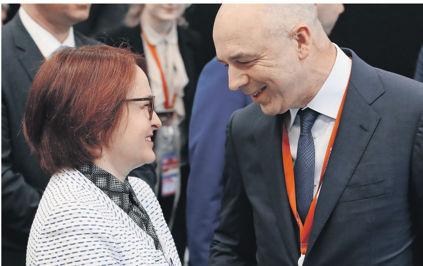
Центробанк может учесть высокие траты бюджета под конец года при решении по ключевой ставке 20 декабря (на фото — председатель ЦБ Эльвира Набиуллина и глава Минфина Антон Силуанов)