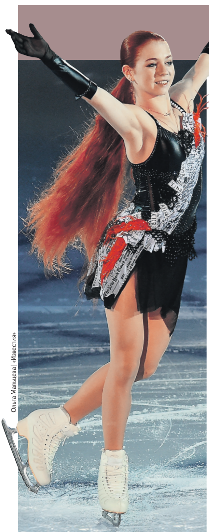
Ольга Минина / Известия