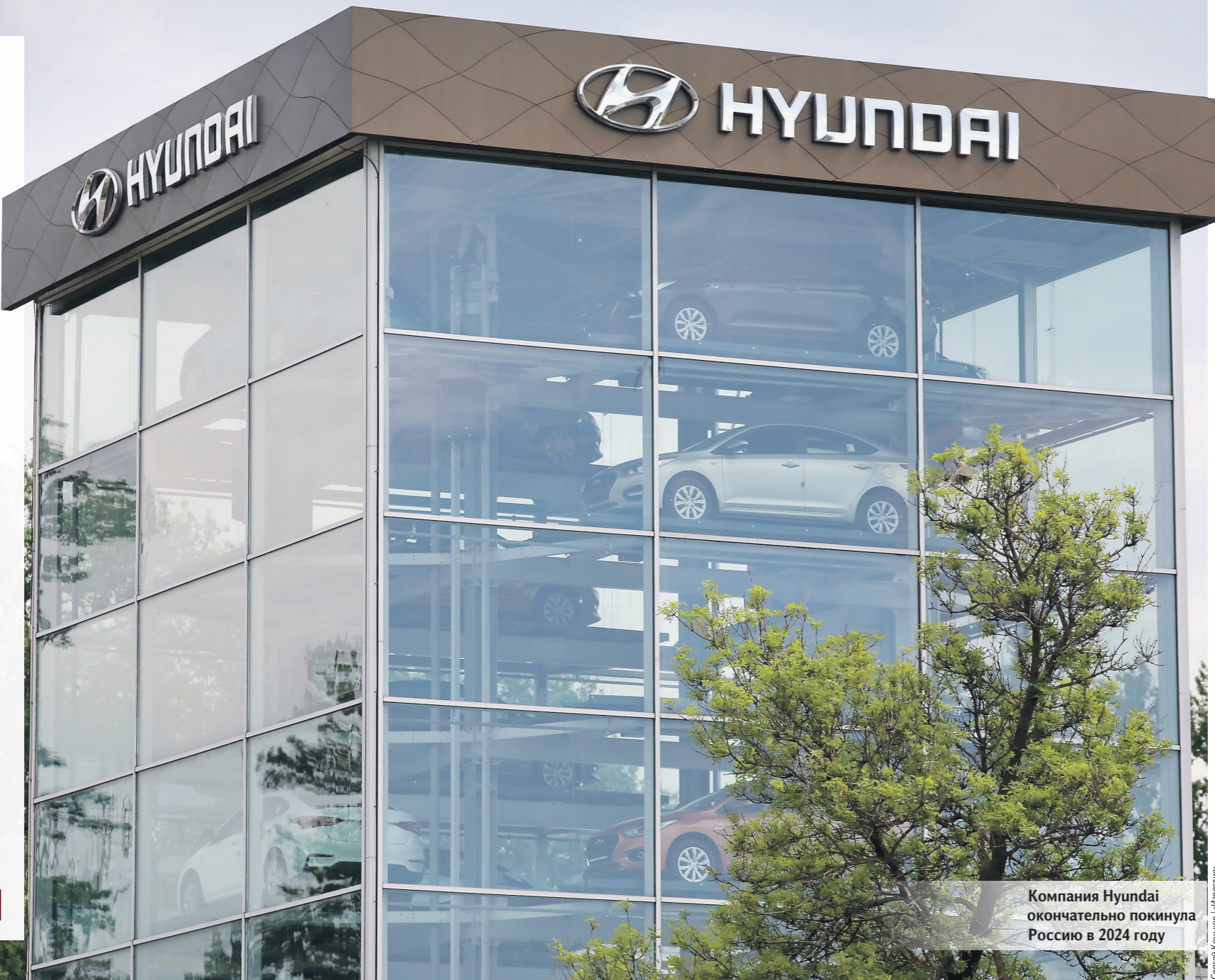
Компания Hyundai окончательно покинула Россию в 2024 году

Речь идёт об иностранных компаниях, у которых нет в России филиала, но они получают прибыль из РФ. При этом доходы в виде дивидендов и процентов по государственным и муниципальным ценным бумагам (например, по облигациям федерального займа или казначейским обязательствам) бюджетный прогноз не учитывает. Они облагаются налогом по другой ставке — 15 вместо 20%. 05 →