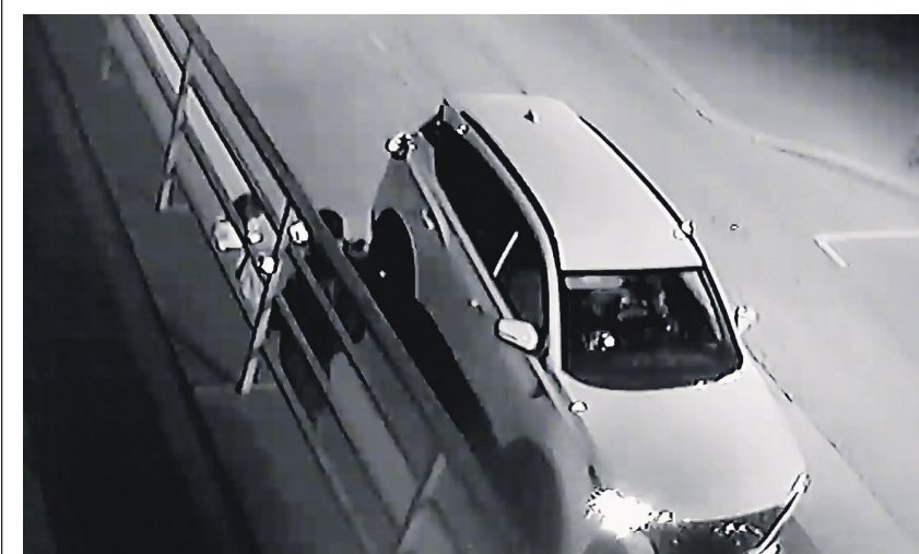
Девушек заманивали в машину якобы для помощи маленькому ребёнку

— К девушкам подъезжали и говорили, что ребёнок нуждается в помощи, они верили и садились в машину, — рассказал следователь. — Там их удерживали и под угрозой расправы оформляли на них через мобильный банк кредит, который тут же требовали снять в ближайшем банкомате. В деле пока восемь эпизодов, но не все пострадавшие на данный момент установлены.