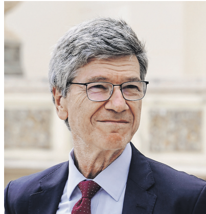
IS by Gabrielia, S. Miron

Поэтому возникает ещё один вопрос: придёт ли Европа