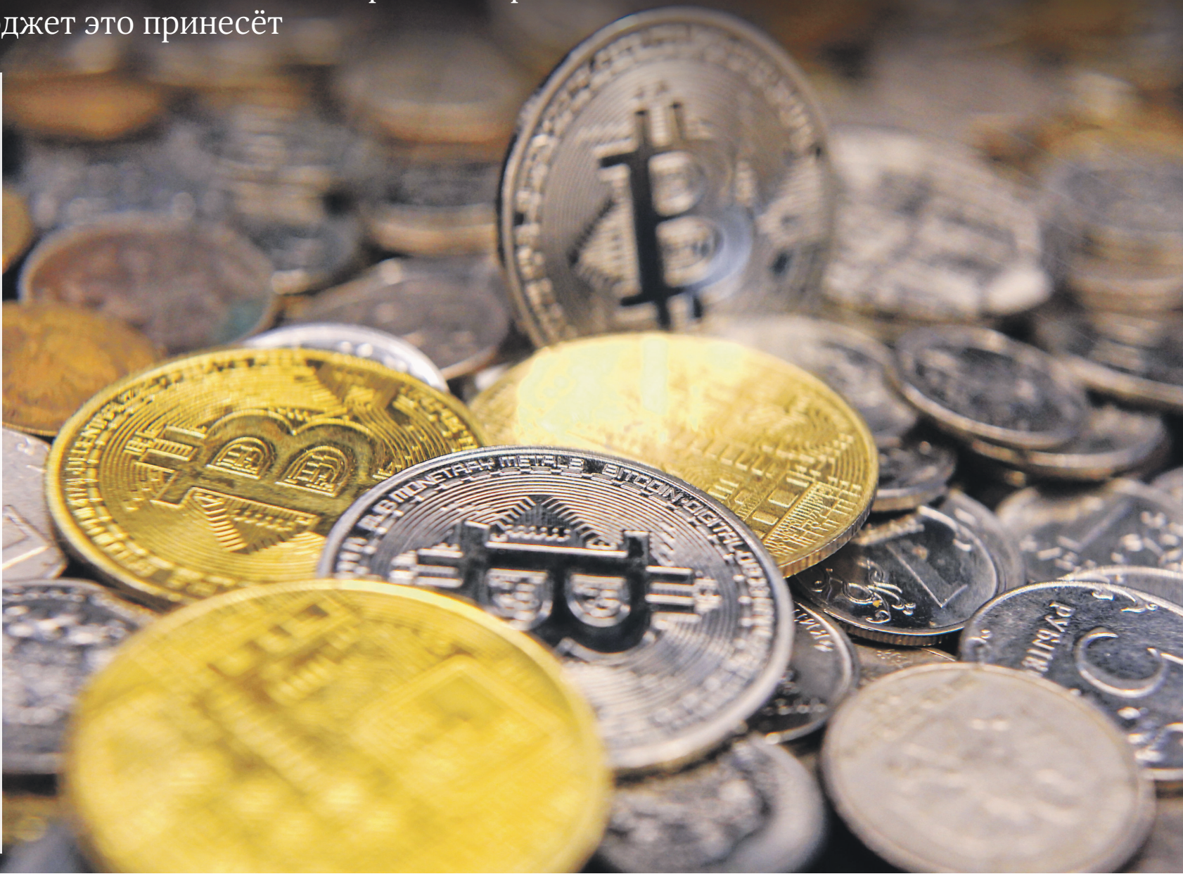
Анна Савина | Известия

Правительственная комиссия по законопроектной деятельности 11 ноября рассмотрела поправки о налогообложении операций с криптовалютами. В документах к заседанию (есть у «Известий») говорится, что законопроект подготовил Минфин и он согласован с Минцифры, Минэнерго и ФНС. Редакция направила запросы в указанные ведомства. Правкомиссия одобрила проект поправок, сообщил «Известиям» источник в кабмине. 05 →