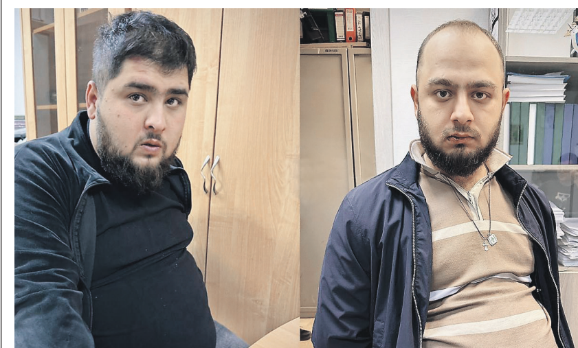
За похищение человека обвиняемым грозит до 15 лет лишения свободы

В реальности их может быть намного больше.