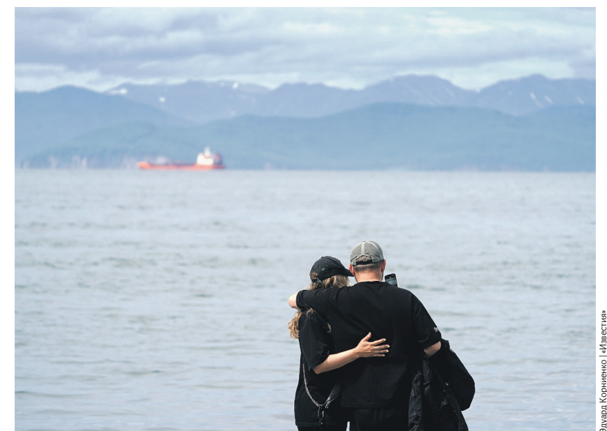
В этом году дальневосточной ипотекой воспользовались 36,8 тыс. заемщиков

В 2024 году дальневосточной ипотекой воспользовались 36,8 тыс. заемщиков, что на 21% превышает показатели за прошлый год, уточнил «Известиям» глава Минвостокразвития России Алексей Чекунков. 06 →