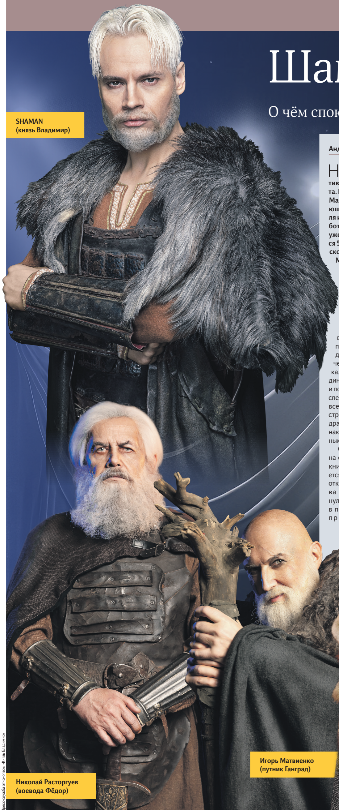
SHAMAN (князь Владимир)