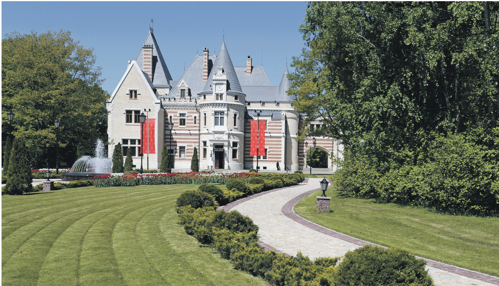
Замок Мейендорф в Барвихе

В надзорном ведомстве уверены: органы исполнительной власти Московской области были введены в заблуждение и спровоцированы на издание незаконных распорядительных актов. «В результате в нарушение закона глава Одинцовского района, губернатор и министр имущества Московской области в отношении земельного надела в отсутствие полномочий распорядились государственной землёй рекреационного назначения», — подчёркивается в иске.