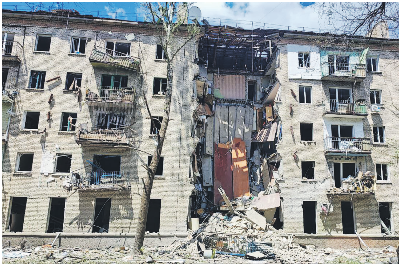
Подъезд дома в Луганске, разрушенный в результате обстрела ВСУ (7 июня)

ВСУ атаковали два многоквартирных дома в Луганске американскими баллистическими ракетами ATACMS, подтвердили в Минобороны РФ. В результате удара полностью обрушился подъезд пятиэтажного жилого дома, а повреждения получили две школы, три детских сада и два учебных заведения.