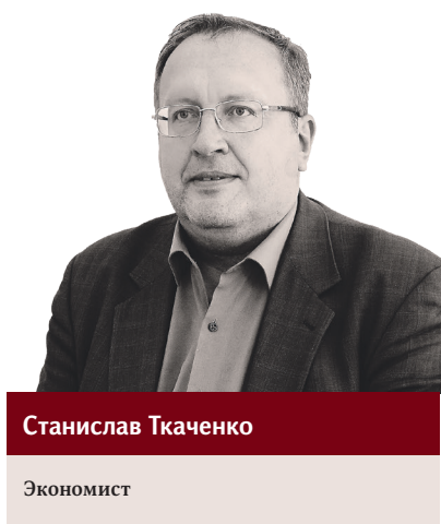
Пресс-служба «Рубль Восток»