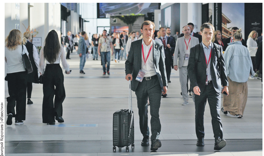
Дмитрий Коротаев / Иллюстрация

Мероприятия освещали 4,2 тыс. отечественных и зарубежных журналистов. «Это много», — отметил Антон Кобяков. 02 →