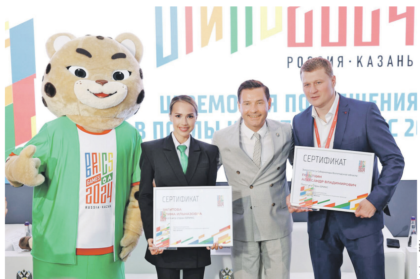
Алина Загитова и Александр Поветкин стали послами Игр БРИКС-2024

спортсменов. — «Известия») и команды добораются до России за свой счёт, а не за счёт организаторов, как это иногда происходит. Несмотря на это, в Казани соберутся спортсмены со всего мира. Это и есть настоящая дружба, проявление уважения к стране-организатору.