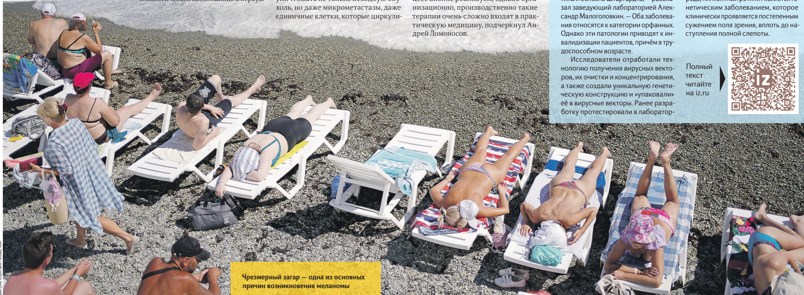
Чрезмерный загар — одна из основных причин возникновения меланомы