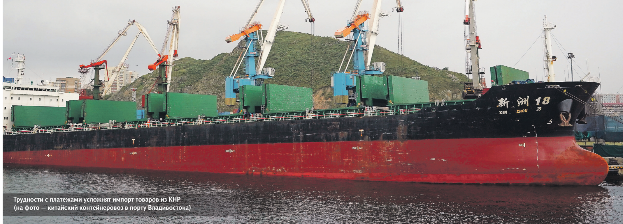
Трудности с платежами усложняют импорт товаров из КНР (на фото — китайский контейнеровоз в порту Владивостока)