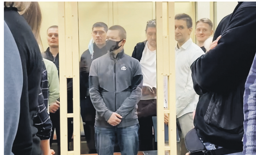
Прокуратура Московской области

Участники ОПС производили в специально оборудованных лабораториях мефедрон, амфетамин, гашиш и другие виды запрещённых растительных и синтетических средств и сбывали бесконтактным способом через тайники-закладки. Одна такая лаборатория действовала в Солнечногорском районе Подмосковья. При обыске оперативники изъяли там целый арсенал оборудования: несколько вакуумных насосов, стеклянные колбы, электронные весы, химические холодильник и реактор,