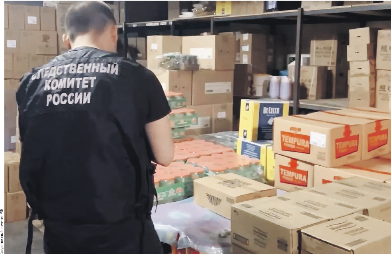
Следственный комитет РФ

Следственный комитет России возбудил уголовное дело по ст. 238 УК РФ («Оказание услуг, не отвечающих требованиям безопасности жизни и здоро-