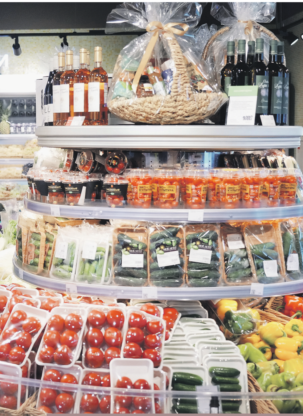
Инфляция с начала 2024 года (% год к году)