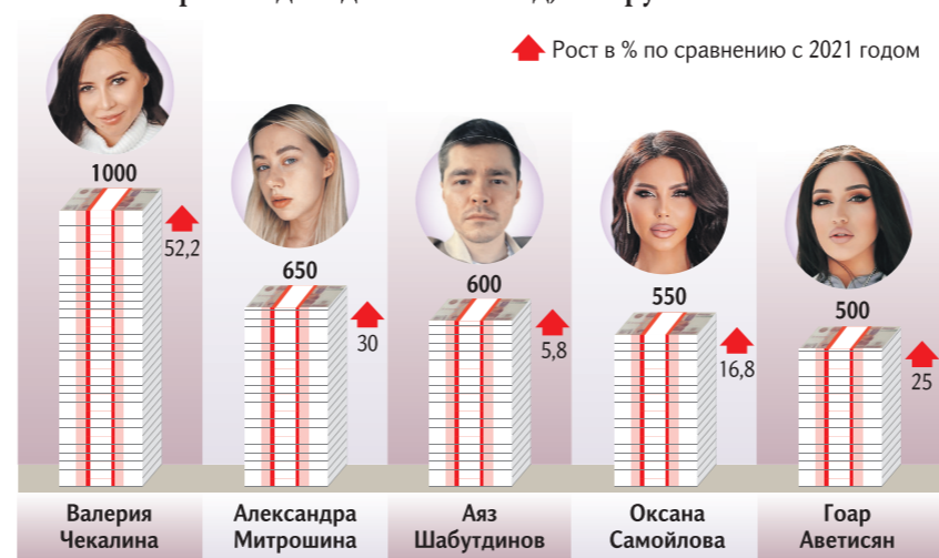
Топ-5 блогеров по доходам за 2022 год, млн руб.

Справка «Известий» Налоговое законодательство предлагает блогерам несколько вариантов легализации доходов. В частности, это особый режим налогообложения (ОСНО), который предусматривает НДФЛ в виде 13% от дохода менее или равного 5 млн рублей. Если блогер заработал больше, уплачивается 650 тыс. плюс 15% от превышающей порог в 5 млн суммы. Упрощённая система налогообложения (УСН) предусматривает ставку 15% от прибыли за вычетом расходов или 6%, если налог рассчитывается только от доходов. При этом есть ограничение доходов в 150 млн рублей.