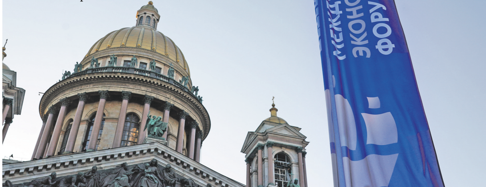
Павел Волков / Иллюстрация

с уходом владельцев торговых марок не прекратится, только логотипы меняются. Прибыль от этого остаётся у нас в стране, — сказал президент, добавив, что иностранные компании освободили до 2 млн кв. м торговых площадей и нишу размером около 2 трлн рублей.