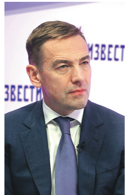
Виктор Евтухов / Известия

Закон обязывает иностранные компании, покинувшие наш рынок и про-