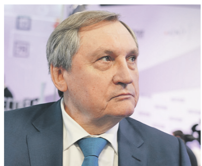
Павел Волков / Иллюстрация

Добыча газа в этом году, конечно, снижается, но мы ориентируемся на прогнозы, которые предусмотрены