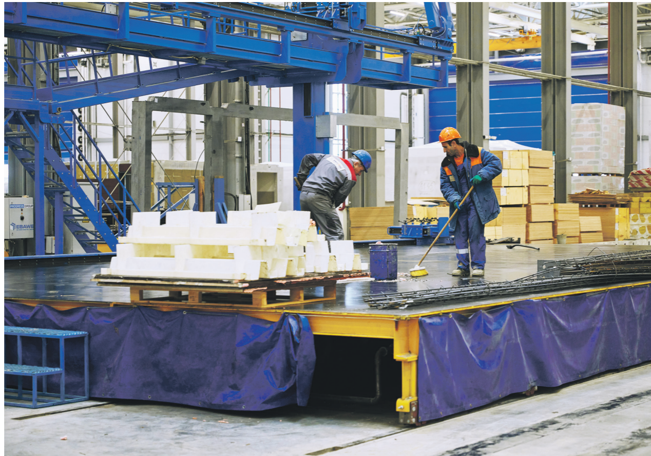
«Монарх», комбинат по производству сверхкрупногабаритных модулей квартир

В начале 2022 года в рамках антикризисного пакета мер поддержки