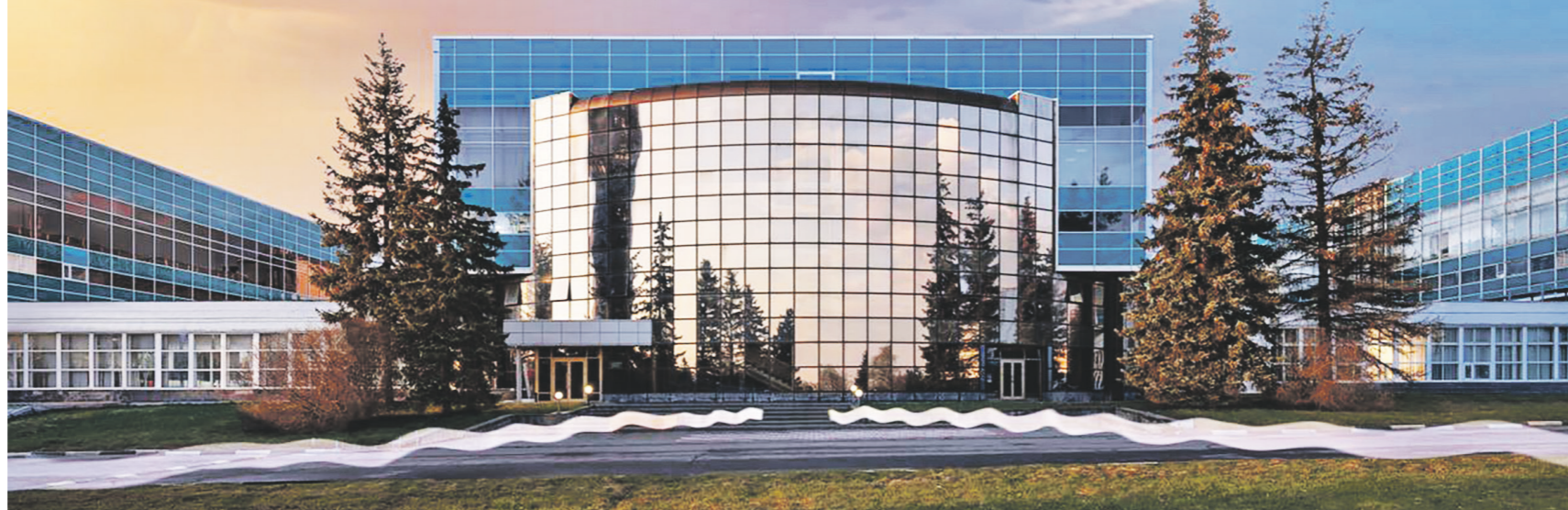
Департамент инвестиционной и промышленной политики города Москвы

Площадь производства в ОЭЗ Москвы вырастет в два раза