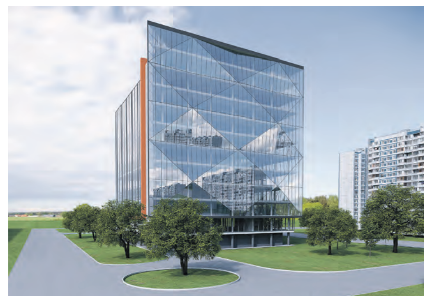
Проект предприятия «ПСК Магистраль Констракшн»

Масштабные инвестиционные проекты 2022 года