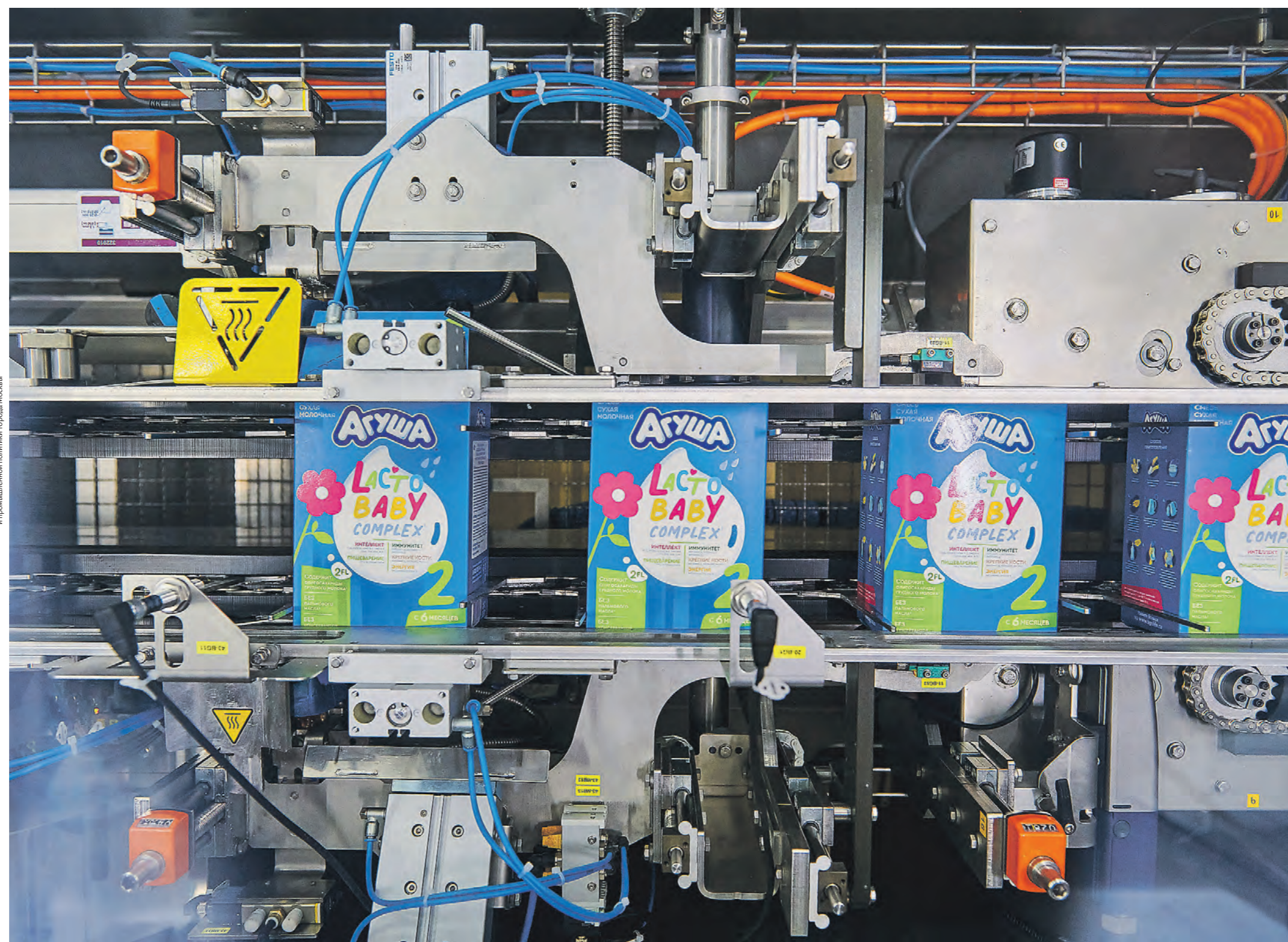
Производство детского питания на «Лянозовском молочном комбинате»

В департаменте подчеркнули, что в июне 2022 года федеральные власти внесли изменения в закон о контрактной системе закупок (44-ФЗ): был снижен минимальный порог инвестиций