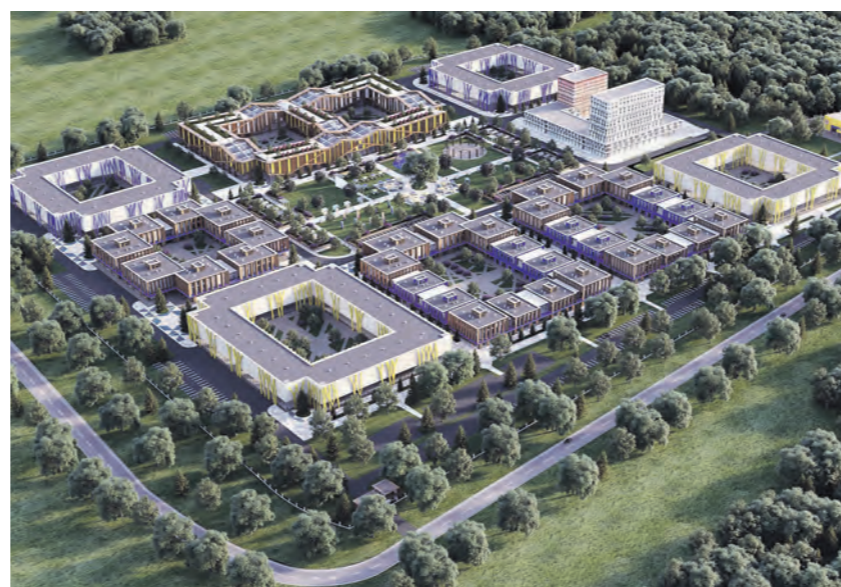
Проект пищевого кластера «КРОСТ»