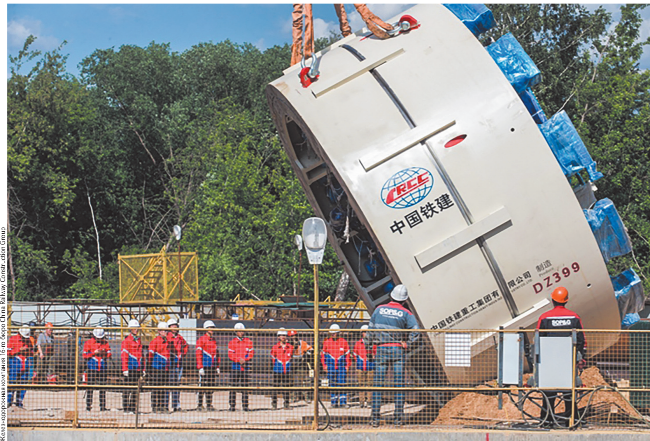
Железнодорожная компания 16-го бюро China Railway Construction Group

Всем сотрудникам дважды в день измеряют температуру, а людей с признаками лихорадки, кашля и других симптомов направляют к врачу и на домашнюю изоляцию. Управляющий персонал проектов в Москве 23 февраля провёл специальное совещание на тему предотвращения эпидемии, обеспечения производства, укрепле-