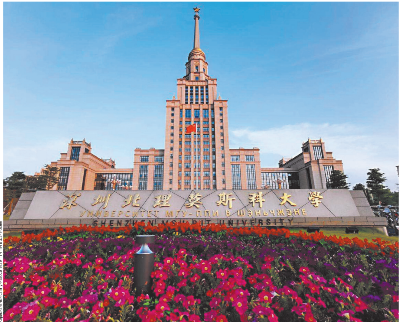
Официальный сайт университета МГУ-ППИ в Шэньчжэне

Научное и академическое сотрудничество стало важной силой в китайско-российских отношениях. В июне состоялась церемония закладки фундамента кампуса, построенного совместно Харбинским технологическим институтом и Санкт-Петербургским национальным исследовательским университетом информационных технологий, механики и оптики (ИТМО). Чанчунский технологический университет и ИТМО совместно запустили программу обучения на степень магистра в области оптической инженерии. С момента своего создания Университет МГУ — ППИ в Шэньчжэне стремится развивать таланты для китайско-российского стратегического сотрудничества.